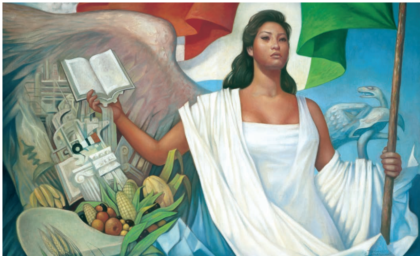
La Patria (1962), Jorge González Camarena

Esta obra ilustró la portada de los primeros libros de texto. Hoy la reproducimos aquí para que tengas presente que lo que entonces era una aspiración, que los libros de texto estuvieran entre los legados que la Patria deja a sus hijas y sus hijos, es hoy una meta cumplida.