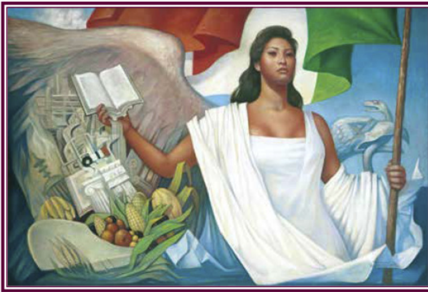
La Patria (1962), Jorge González Camarena.

Esta obra ilustró la portada de los primeros libros de texto. Hoy la reproducimos aquí para mostrarte lo que entonces era una aspiración: que los libros de texto estuvieran entre los legados que la Patria deja a sus hijos.