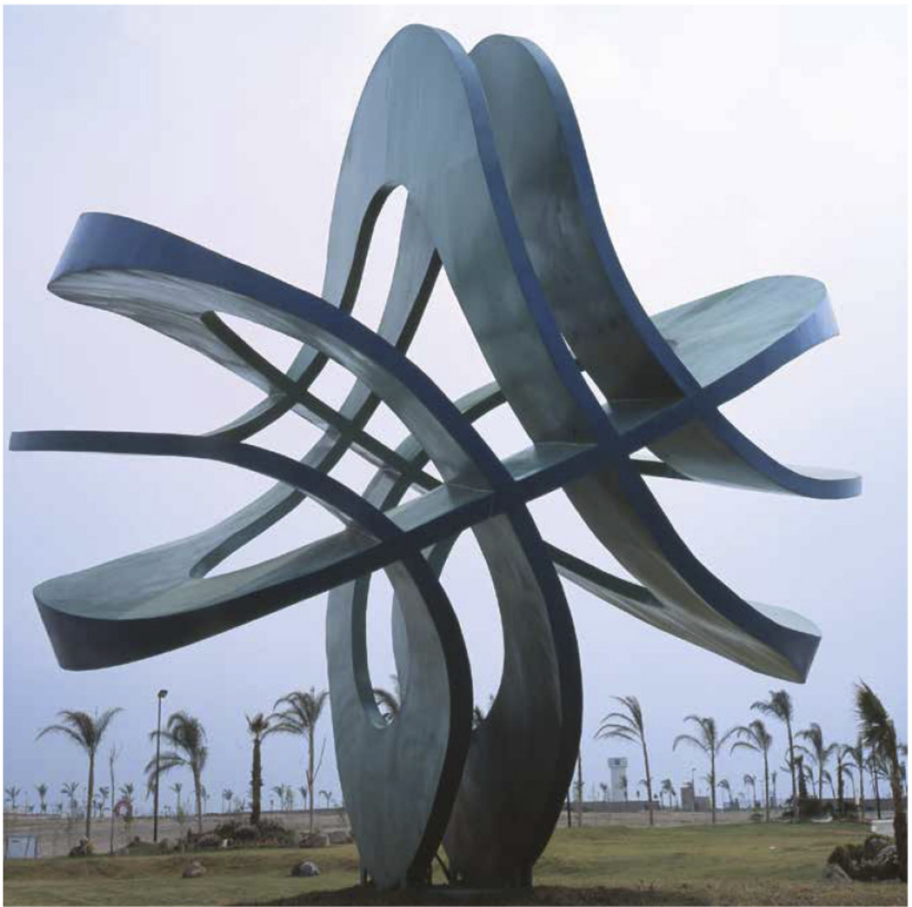
Yvonne Doméngue (1946- ), Circontinuo , 2004, escultura monumental, acero al carbón (6 m. de diámetro).