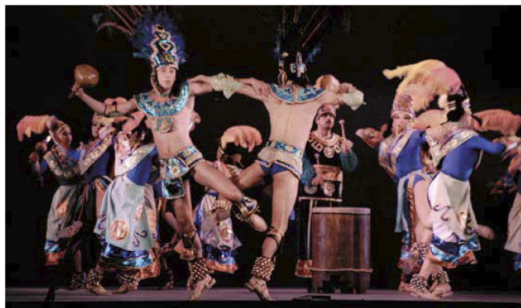
Danza de la purificación, Chiapas.