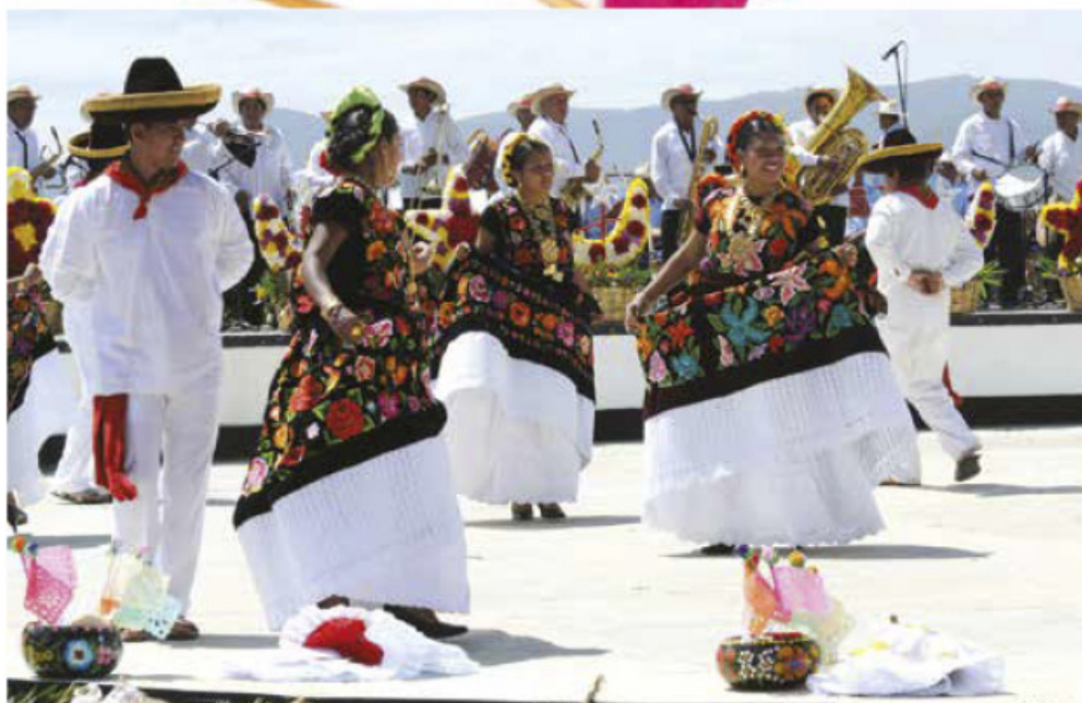
La sandunga, Juchitán, Oaxaca.