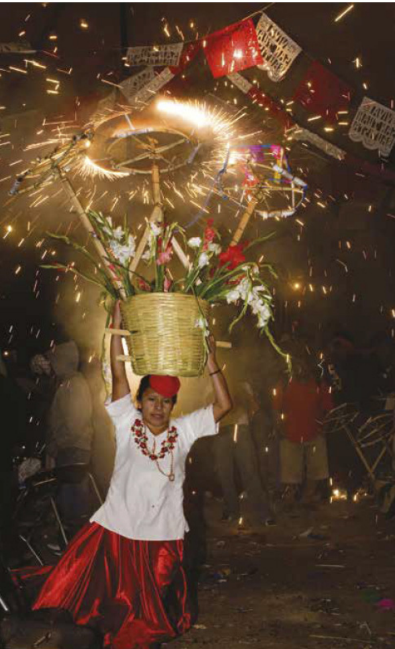
Baile de las chinas oaxaqueñas durante la calenda, Valles Centrales, Oaxaca.

Necesitarás música (preferentemente de orquesta), tijeras, cinta adhesiva y cartulina.