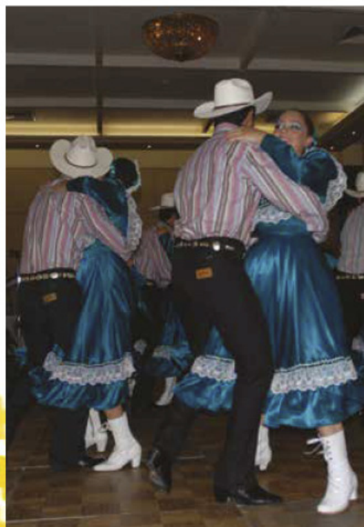
Polca norteña, Saltillo, Coahuila.

Los pasos y las evoluciones corporales de los bailes sufren transformaciones a lo largo del tiempo. Sin embargo, actualmente algunos grupos o compañías de danza tratan de rescatar y preservar su originalidad.