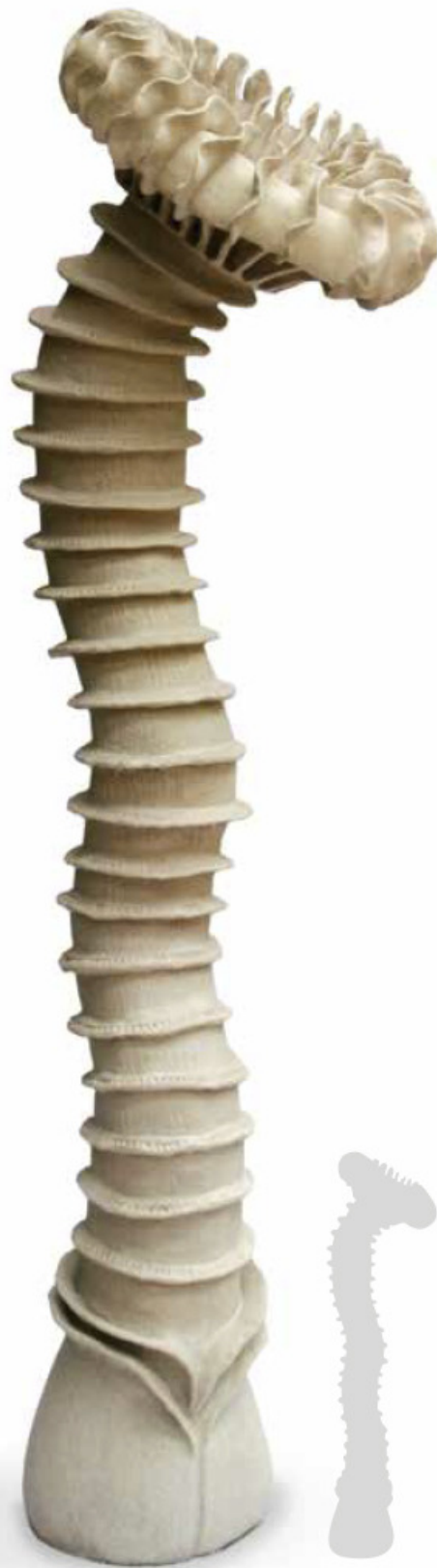
Maribel Portela (1960- ), Palmaeformis detractora , 2008, barro y engobe (170 × 47 × 47 cm).

Necesitarás música tradicional mexicana y un reproductor de sonido para el grupo.