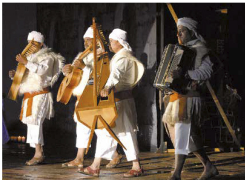
Músicos en el Carnaval Chamula, Chiapas.

La próxima clase entrega a tu maestro una hoja donde describas tus experiencias con un género de música que no conocías.