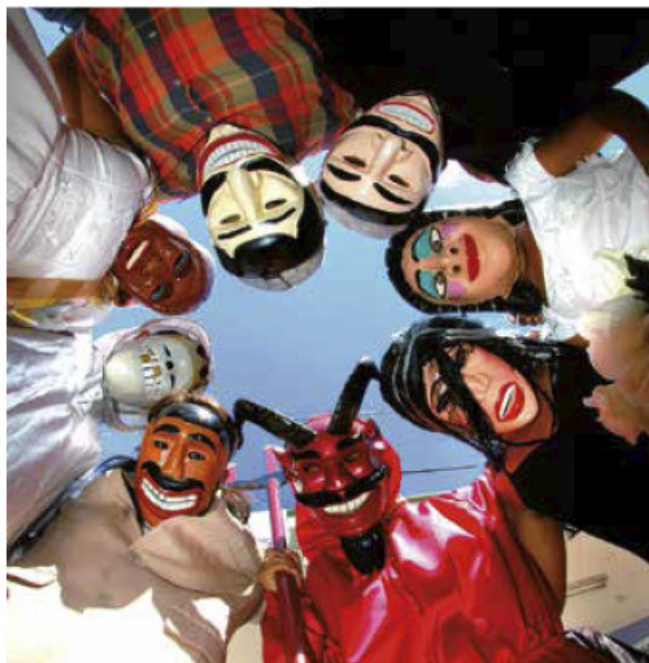
Baile de máscaras, Veracruz.

Necesitarás objetos y materiales del Baúl del arte que puedas emplear para elaborar esculturas o pinturas. Elige la técnica y los materiales que más te gusten.