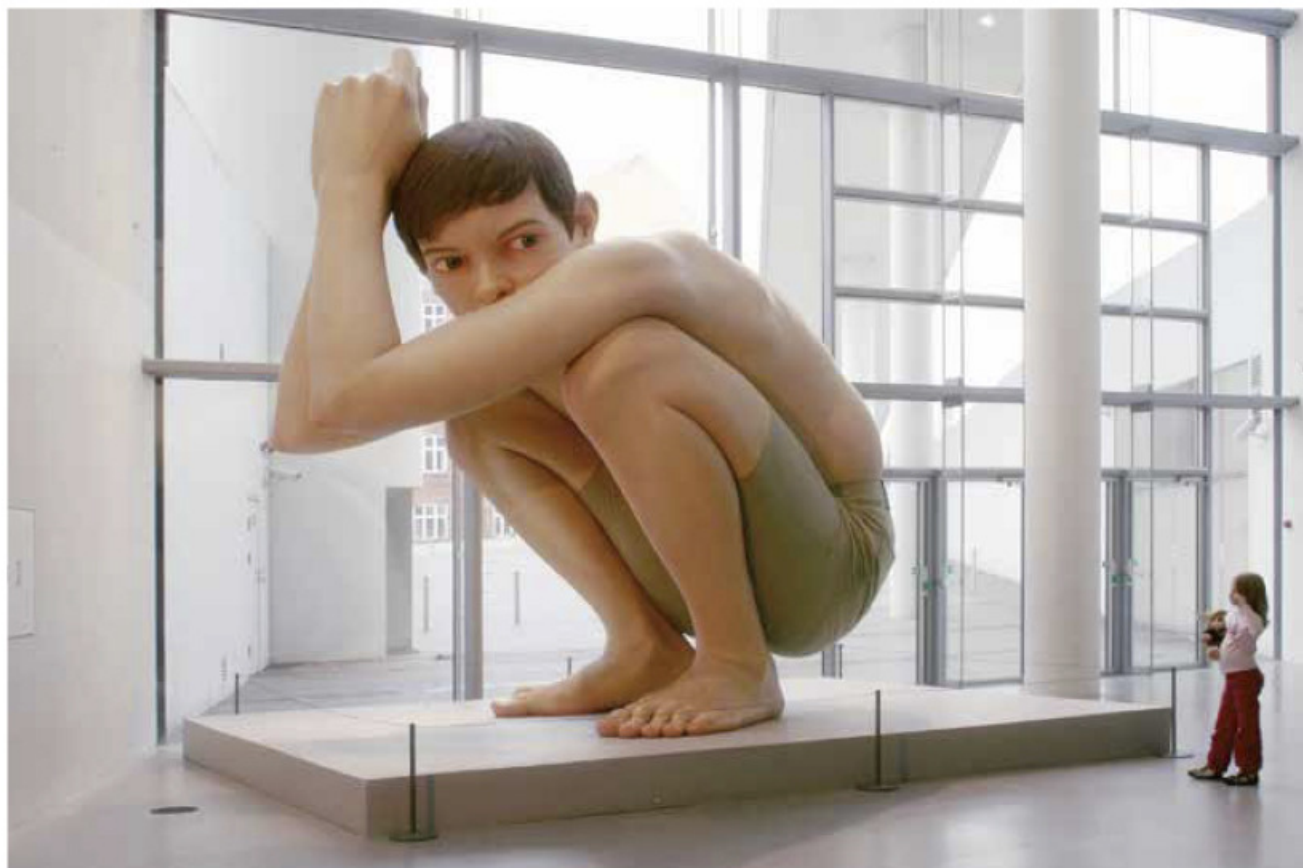
Ron Mueck (1958-) Boy , 1999, técnica mixta (5 m de altura), Museo Aarhus Kunstmuseum, Dinamarca.