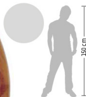
Frida Kahlo (1907-1954), Naturaleza muerta , 1942, óleo sobre lámina de cobre (63 cm de diámetro).