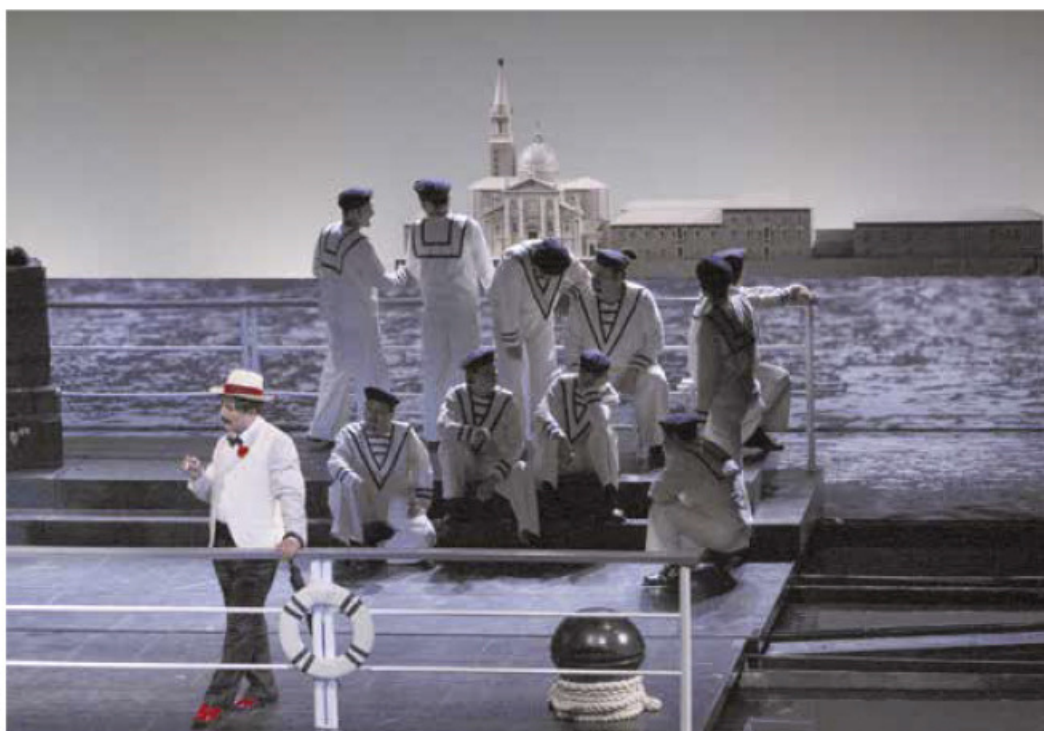
Muerte en Venecia, Compañía Nacional de Ópera de México.