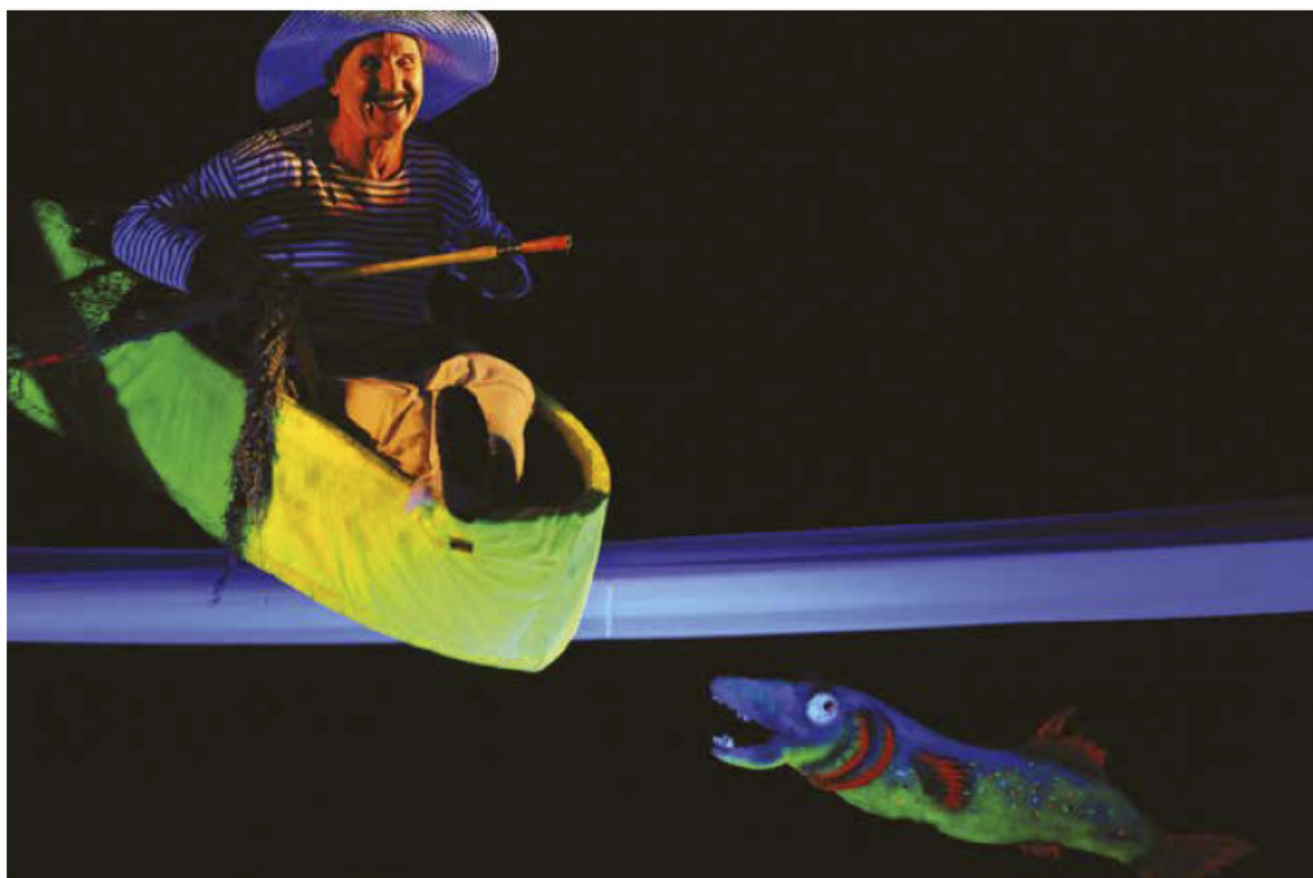
Las aventuras de Fausto, Teatro Jorge Isaacs, Cali, Colombia.

El teatro ha cambiado a lo largo del tiempo y seguramente seguirá cambiando al incorporar elementos derivados de las nuevas tecnologías.