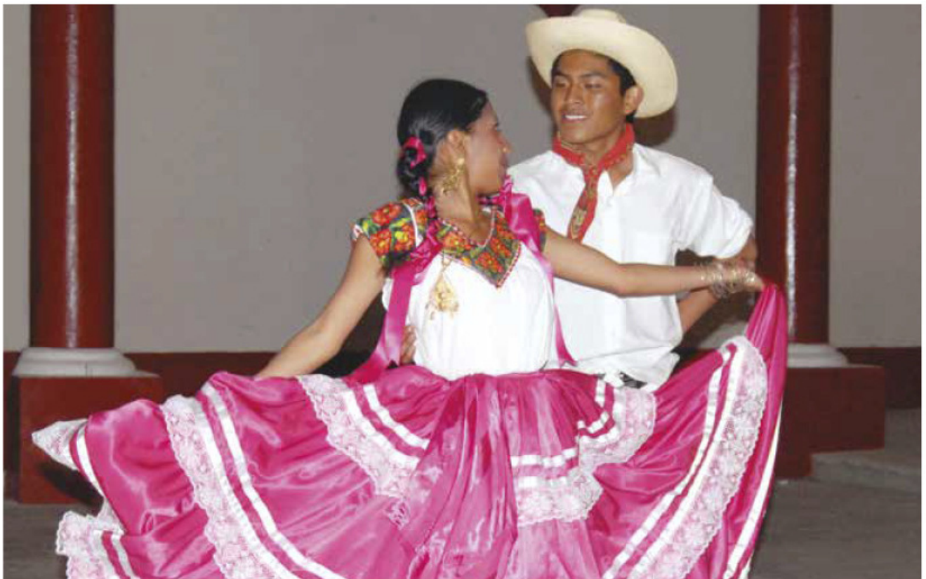
Sones y chilenas, Santiago Pinotepa Nacional, Oaxaca.